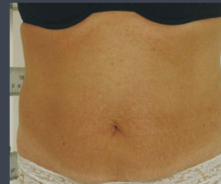
1 MOIS APRÈS 10 SÉANCES HEBDOMADAIRES